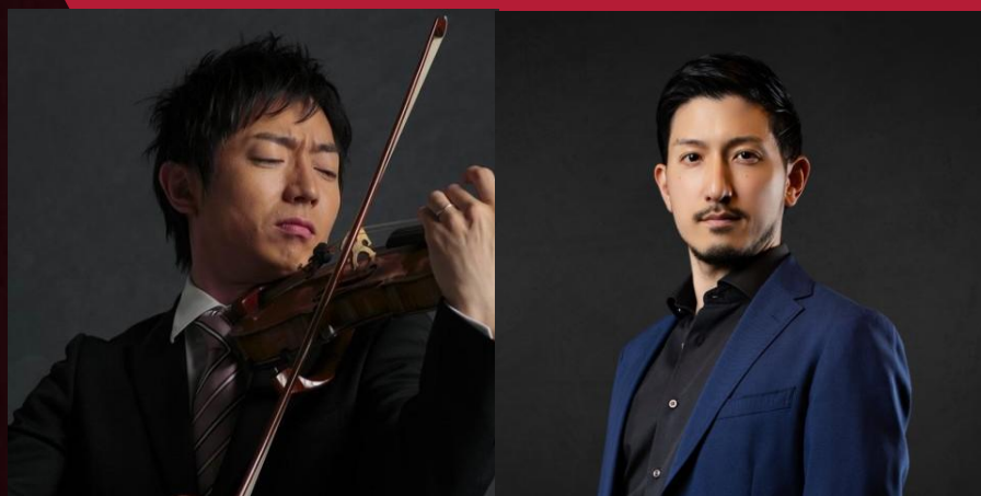
ヴィッレ・ヒルトウラ・トリオ